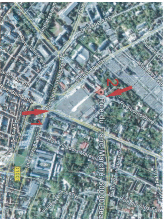
Localisation des photographies