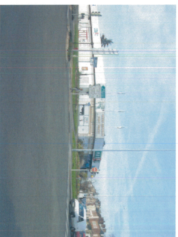
1 - Photographie dans l'environnement proche