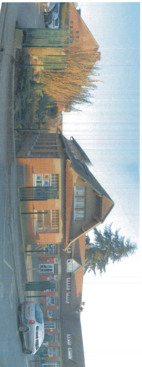
2 - Photographie dans l'environnement lointain